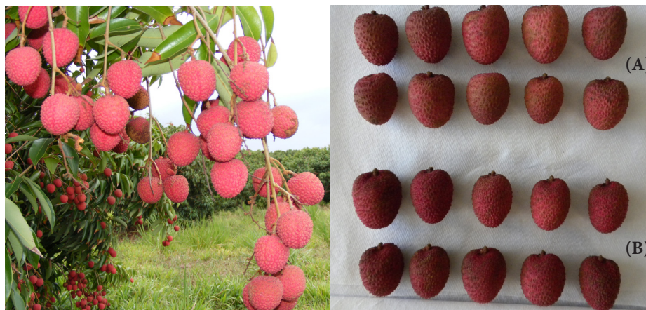
Figura 1. Cultivares de litchi Mauritius(A) y Brewster(B), considerados para el análisis de calidad en el estado de Veracruz.