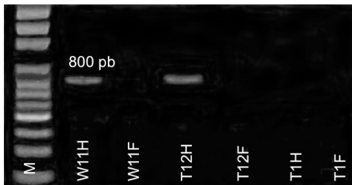
Figura 3. Electroforesis de productos de marcadores SCAR en papaya 'Maradol' en un compuesto de cinco plantas hermafroditas y uno de cinco plantas femeninas. Marcador W11 en plantas hermafroditas (W11H), W11 en plantas femeninas (W11F), T12 en plantas hermafroditas (T1H) y T1 en plantas femeninas (T1F). M es el marcador escalera de tamaños.