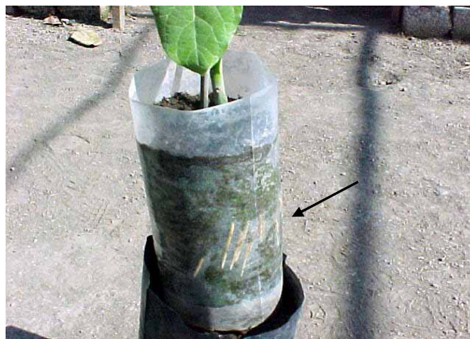
Figura 1. Raíces adventicias visibles (ver flecha) a través del tubo de plástico transparente, provenientes de un tallo de aguacate.

En los tallos en que no hubo emisión de raíces, fue notoria la presencia de callo que unió la corteza de ambos extremos del anillado; arriba del sitio del anillado se formaron primordios de raíces adventicias que no desarrollaron normalmente.