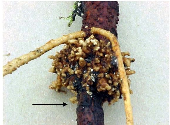
Figura 3. Tallos anillados de aguacate con pobre desarrollo de raíces adventicias. La flecha señala la parte inferior del anillado.

La menor proporción del total de tallos enraizados ocurrió en las selecciones tolerantes a P. cinnamomi (57 %). El nivel de enraizamiento varió de 26 % (Duke 7) a 94 % (P-1), y en seis de las nueve selecciones fue obtenido al menos 50 % de plantas enraizadas (Cuadro 4).